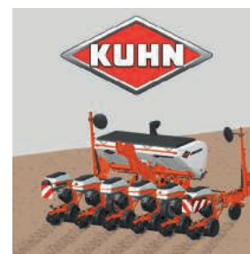
Click & Seed

Firma KUHN opracowała aplikacje ułatwiające wybór siewnika zgodnie z potrzebami klienta, a także pomoc w dostosowaniu siewników punktowych KUHN.